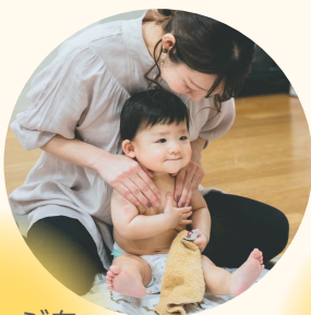
マッサージを 覚えられる