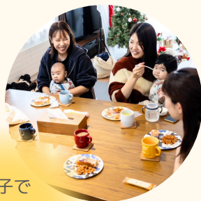
親子で お友達が できる