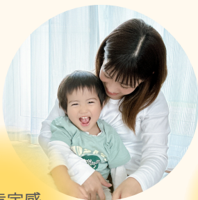
自己肯定感 アップ