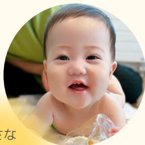
小さな 成長にも 気付ける